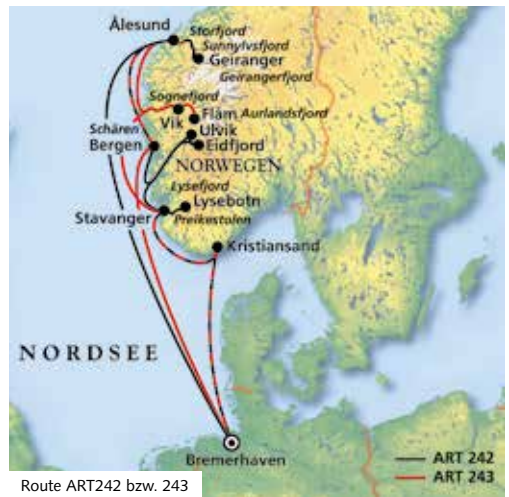
Route ART242 bzw. 243