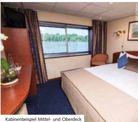
Kabinenbeispiel Mittel- und Oberdeck

Wird die Mindestteilnehmerzahl nicht erreicht, werden Sie spätestens 4 Wochen vor Reisebeginn über das Nichtstattfinden Ihrer Reise in Kenntnis gesetzt.