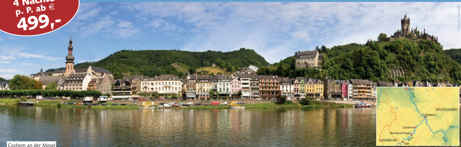
Cochem an der Mosel